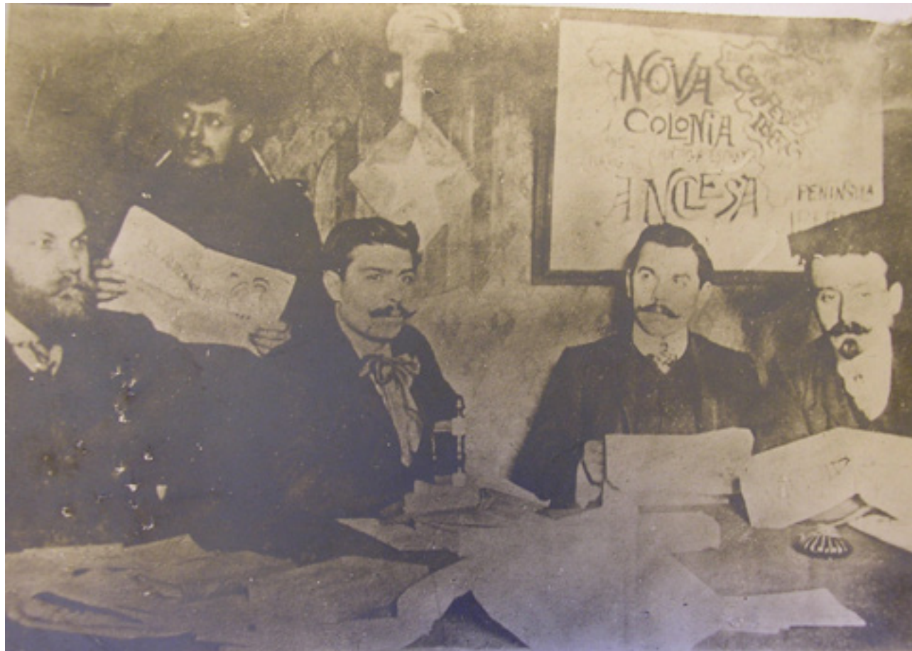
Foto del comitè separatista català de París

Asseguts al voltant d'una taula, tenen penjada a la paret un escut amb la bandera catalana i l'estrella de cinc puntes separatista. Com és sabut, aquest símbol havia nascut a Cuba entre els elements radicals del Centre Catalanista de Santiago de Cuba. El seu ús per part del grup de Díaz Capdevila fa pensar en l'existència de relacions entre ambdós grups o a través d'altres entitats del nacionalisme radical, molt probablement via la Unió Catalanista o via publicacions com la revista Metral·la . Díaz Capdevila va col·laborar amb aquesta publicació al llarg de 1907 i 1908, explicant els actes que feien a París com a «republicans catalanistes» o «radical-socialistes catalans». En la foto també es veu un mapa penjat a la paret que mostra una península dividida entre una «Confederació ibèrica» (que incloïa Catalunya, València, Aragó, i les províncies basco-navarreses) i la resta de la península («antiga Espanya» i Portugal), anomenada «Nova colònia anglesa».